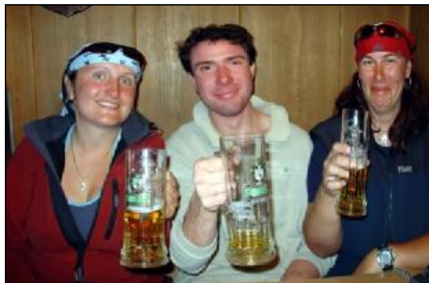
Kluci mají docela pěkné webové stránky, kde najdete i nějaké horolezecké průvodce po Itálii, můžete mrknout na www.rampegoni.it .