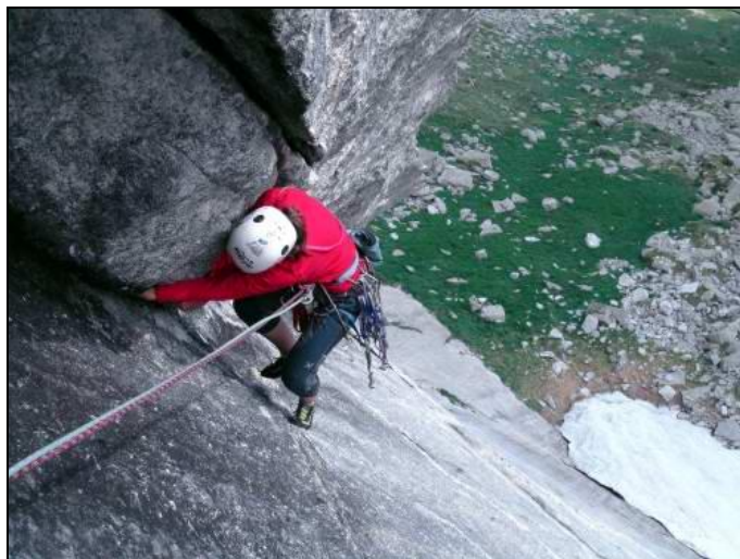
Foto z tréninku..