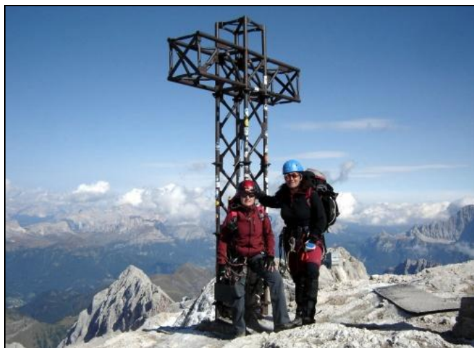
Vrchol Marmolada di Penia

A tak to šlo pořád dokola, pořád hodně strmě nahoru, žebříky, kramle, zdálo se to nekonečné. Ale přece jen už jsme šly po vrcholovém ledovci kolem chaty, a v 15:15 jsme stanuly na vrcholu Marmolada di Penia – 3342 m.