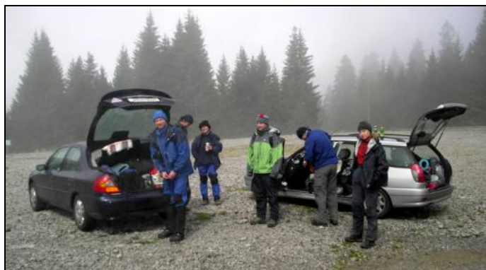
Přípravy před startem..