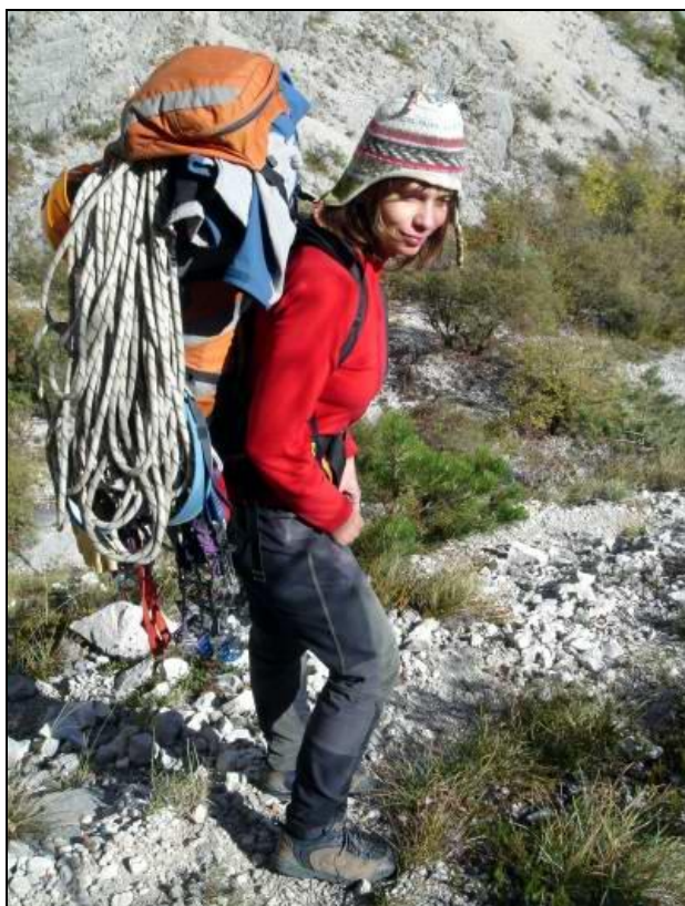
Další z půvabů lezení velkých stěn – vynáška..