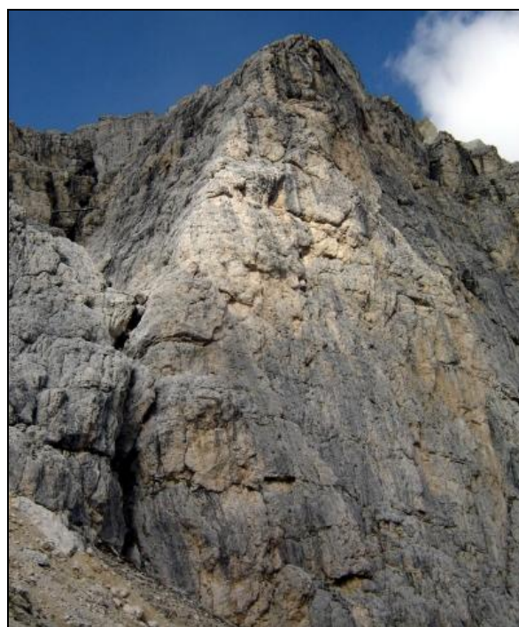
Naše stěna - Lagazuoi

Předem jsme se domlouvali na nějakých lehkých cestičkách, a tak když jsme na kluky čekaly na parkovišti na Passo Falzarego, měly jsme představu, že polezeme asi něco jako Saas de Stria kousek oopodál, o kterých jsme četly na lezci.