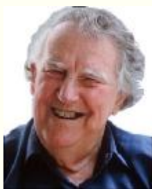
SIR EDMUND HILLARY

„Ano. Vábilo mne také nebezpečí. Strach je stimulačním faktorem, který se značnou měrou podílel na důvodech, pro něž jsem se stal horolezcem. Naleznete-li něco, co je obtížné a nebezpečné a možná i trochu děsivé, ale vytrváte a překonáte to, poskytnete vám to daleko větší pocit uspokojení..“