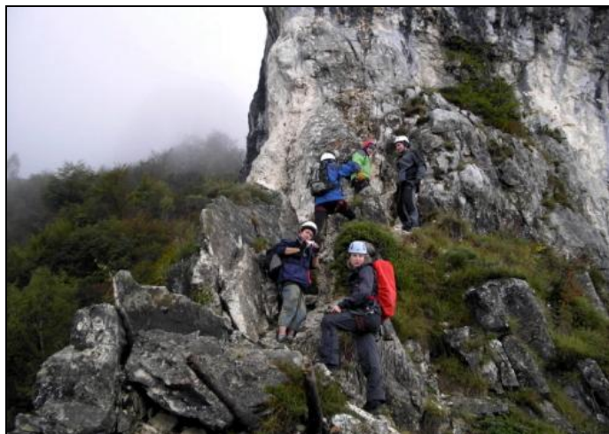
U nástupu na Cimu Sat..

Výstup pod Cima Capi – Camp Riva (70 m) sedlo pod Cima Capi a zpět asi (700 m). Délka výstupu 4 hodiny. Převýšení 650 m.