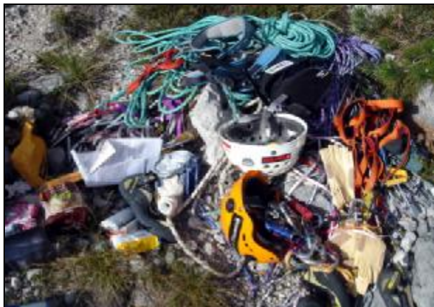
Část matroše do velké stěny..