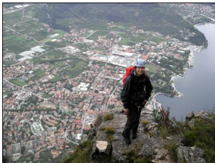
Cestou byly výhledy jako z letadla. Škoda, že nevyšlo lépe počasí. Chvillemi i přšelo..

Tremalzo (1500 m) - Bocca Caset (1600 m) postup po turistické cestě č. 419, dále vysokohorským, částečně zajištěným chodníkem č. 456B po rozezklaném hřebenu na Cima Caset (1748 m) a na Monte Corno (1731 m).