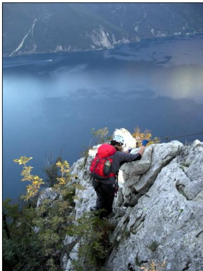
Krásné výhledy cestou na Cimu Sat

Přejezd z Lago di Garda k osadě Tremalzo (1500 m).